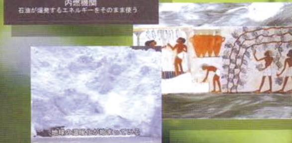
地球の環境が壊れている