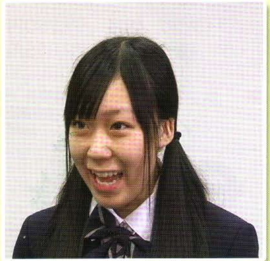
ネクタイは ゆるんでいては駄目