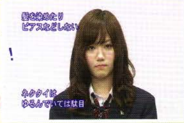
髪を絞めたり ピアスなどしない