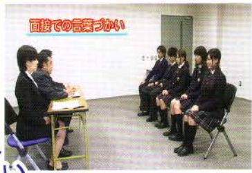
面接での言葉づかい