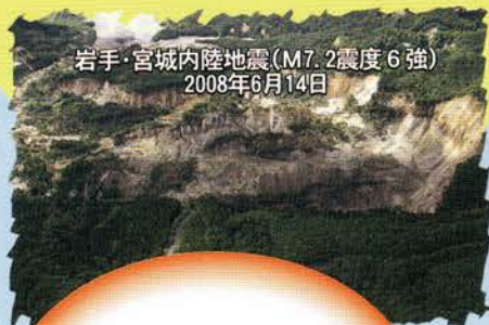
岩手・宮城内陸地震(M7.2 震度6強) 2008年6月14日