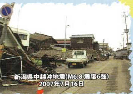
新潟県中越沖地震(M6.8 震度6強) 2007年7月16日