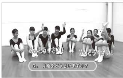
Q. 月経をどう思いますか?