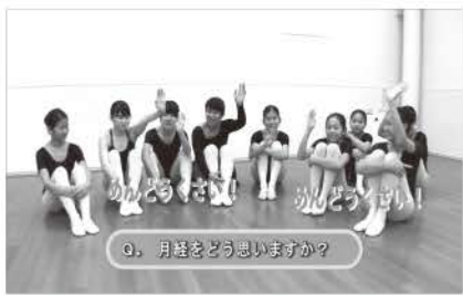
Q. 月経をどう思いますか?